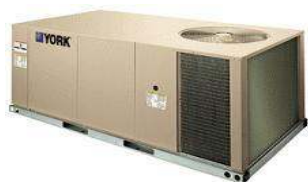
DM / BQ / BP